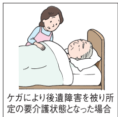
ケガにより後遺障害を被り所定の要介護状態となった場合