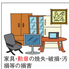
家具・勲章の焼失・破損・汚損等の損害