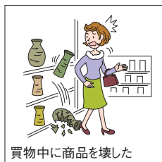
買物中に商品を壊した