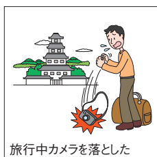
旅行中カメラを落とした