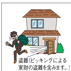
盗難(ピッキングによる家財の盗難を含みます。)