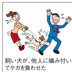
飼い犬が、他人に噛み付いてケガを負わせた