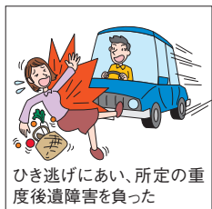
ひき逃げにあい、所定の重度後遺障害を負った