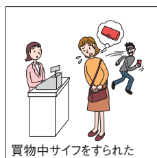
買物中サイフをすられた