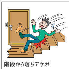
階段から落ちてケガ