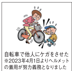
自転車で他人にケガをさせた ※2023年4月1日よりヘルメットの着用が努力義務となりました