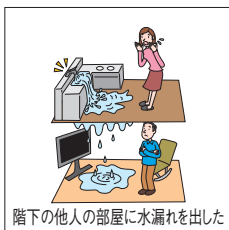
階下の他人の部屋に水漏れを出した