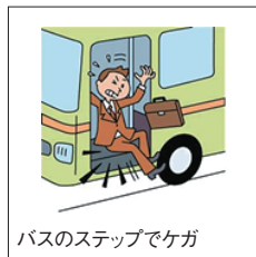
バスのステップでケガ