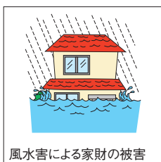
風水害による家財の被害