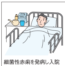
細菌性赤痢を発病し入院