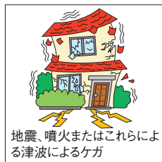
地震、噴火またはこれらによる津波によるケガ